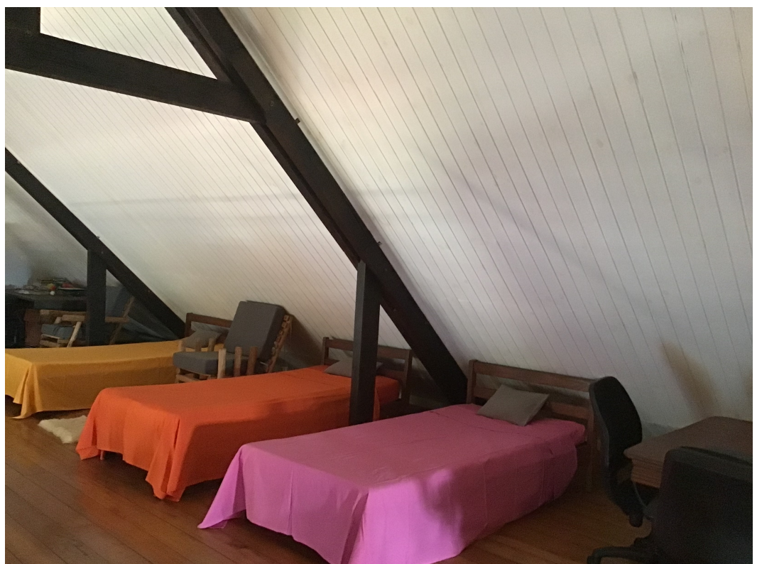
Trip to Madagascar